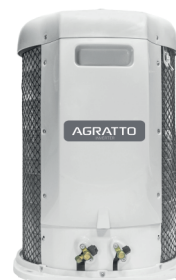
CONDENSADORA TOP DISCHARGE