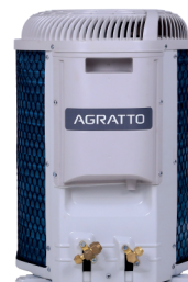
CONDENSADORA TOP DISCHARGE