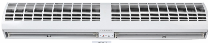
CORTINA DE AR